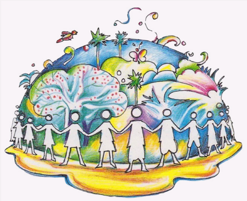
Bildnachweis: Enclosures and Recovery of the Commons, Navdanya