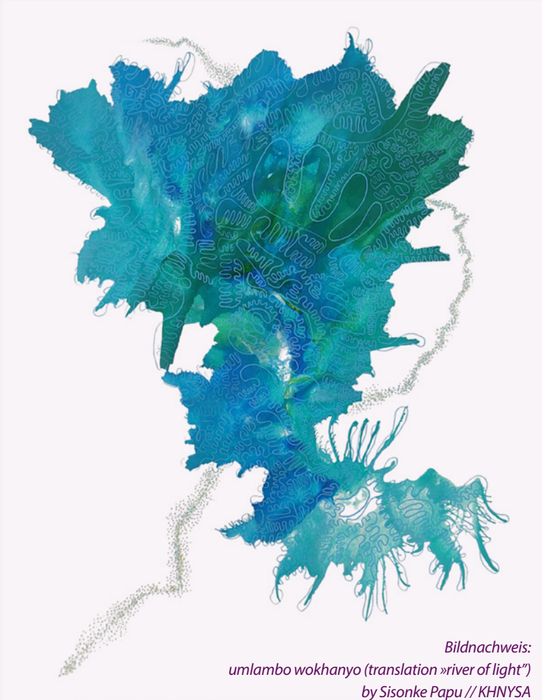
Bildnachweis: umlambo wokhanyo (translation »river of light«) by Sisonke Papu // KHNYSYA

»Diese Arbeit ist eine beständige Erkundung »izithunywa zendalo: amanzi« (Bote der Natur: Element Wasser) und stellt die Fluidität des Atems in den Mittelpunkt. Der Fluss des Lichts kann auch als das Energiesystem betrachtet werden, das unser Nervensystem durchzieht, das wiederum die Adern in Pflanzen und Flusssystemen sowohl über als auch unter der Erde darstellt.«