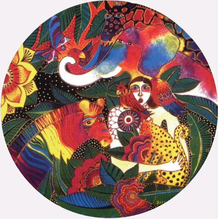
Bildnachweis: Schutz der Vielfalt, Widerstand gegen Monokulturen und Kampf gegen Monopole – DWD